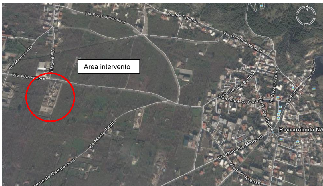
Vista aerea dell'area di intervento

Di seguito si riportano due viste aeree dell'area oggetto di intervento.