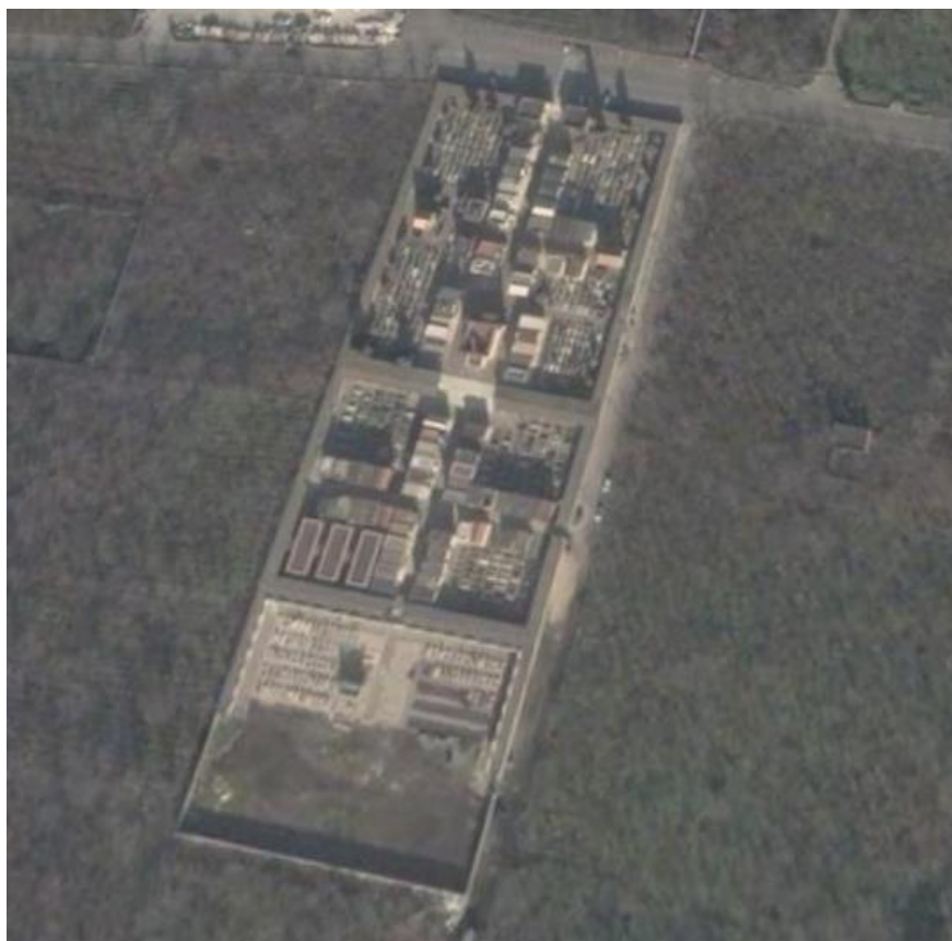
Vista aerea dell'area di intervento

La zona in esame non è assoggettata da alcun vincolo di tipo archeologico, paesaggistico, ambientale e gli interventi di progetto sono conformi alle prescrizioni urbanistiche ed edilizie attualmente vigenti sul territorio comunale.